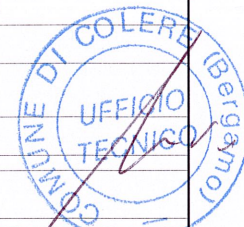
TABELLA A - NUOVE COSTRUZIONI - DEMOLIZIONI E RICOSTRUZIONI