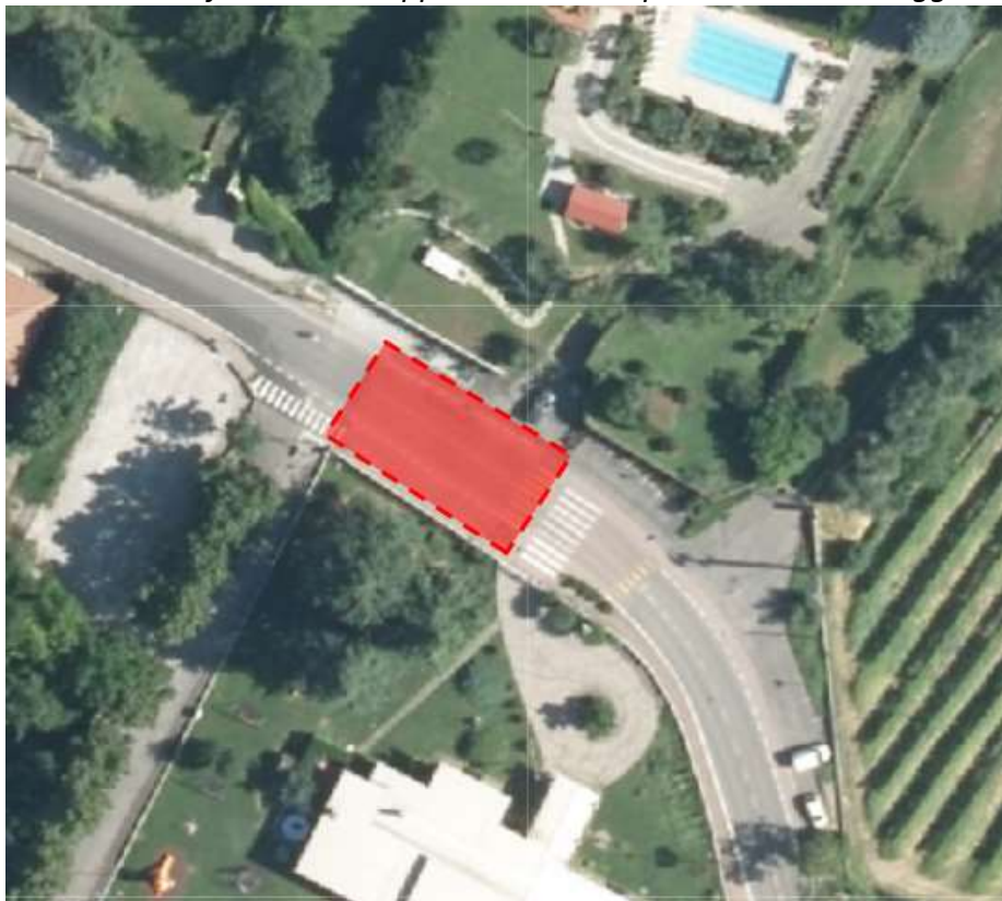
Via Manzoni: fresatura + tappeto zona parcheggio