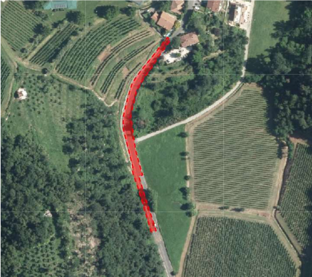
Via Manzoni: fresatura + tappeto+messa in quota chiusini carreggiata