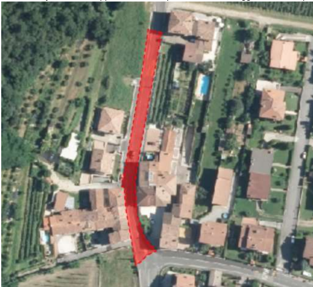
Via Manzoni: fresatura + tappeto+messa in quota chiusini mezza carreggiata e marciapiede