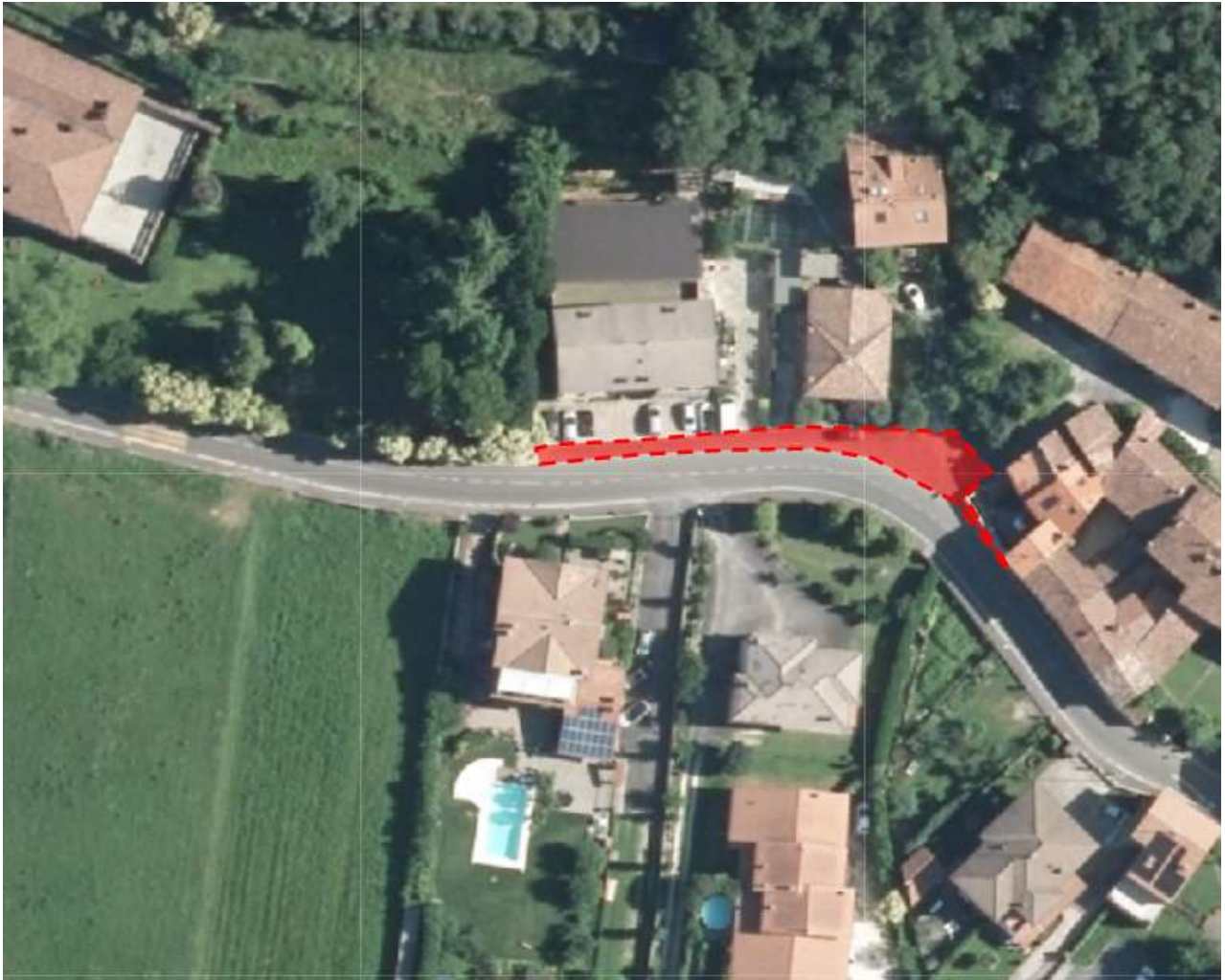
Via Fontana: fresatura + tappeto+messa in quota chiusini carreggiata, mezza carreggiata e marciapiede