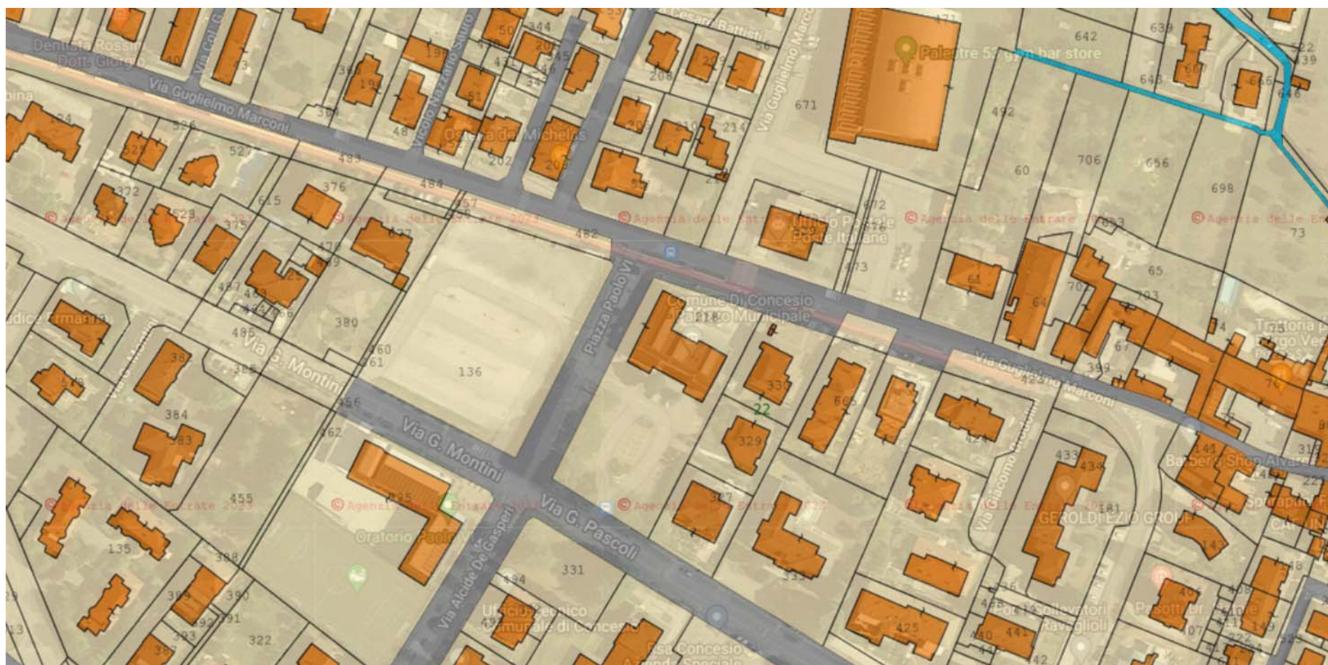
Stralcio sovrapposizione Catastale / Ortofoto