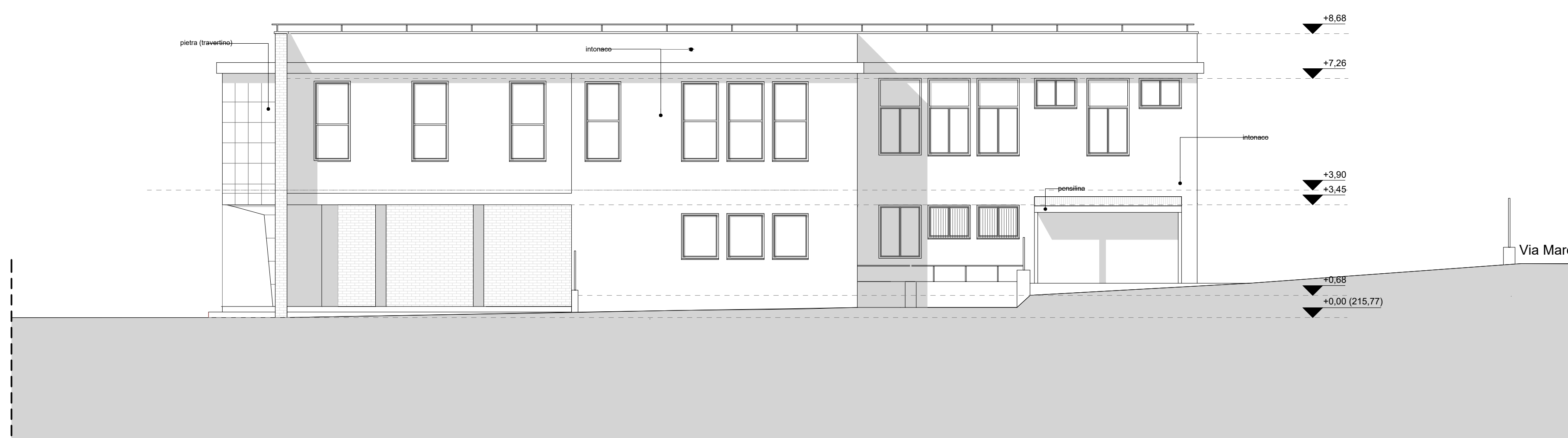
PROSPETTO EST scala 1:100