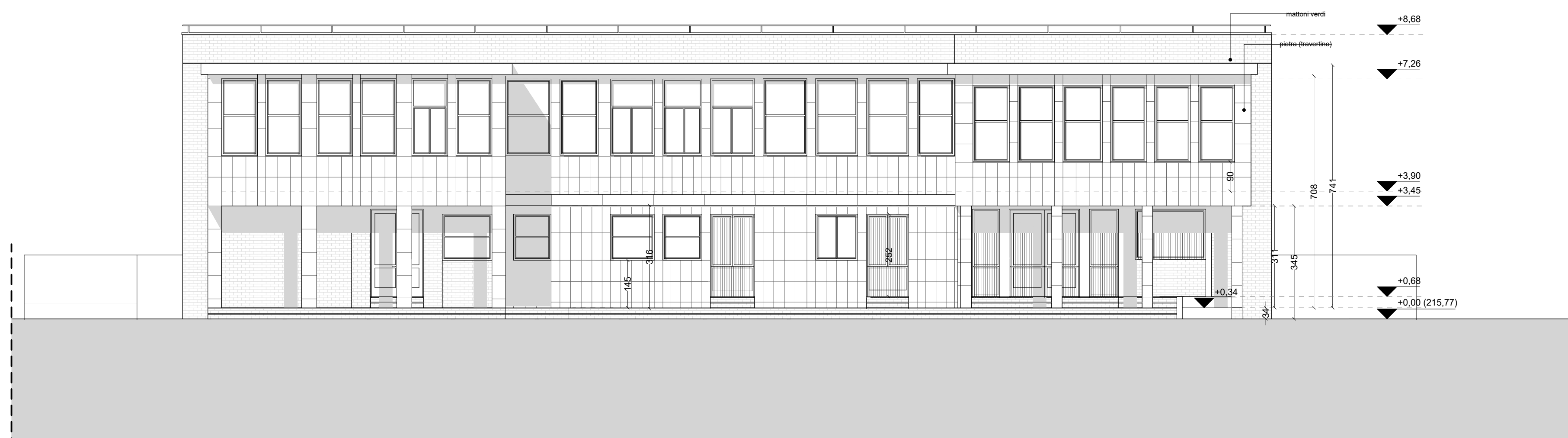
PROSPETTO SUD scala 1:100