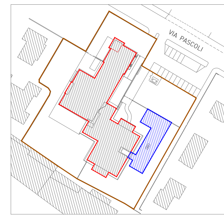
K PLAN - 1:1000