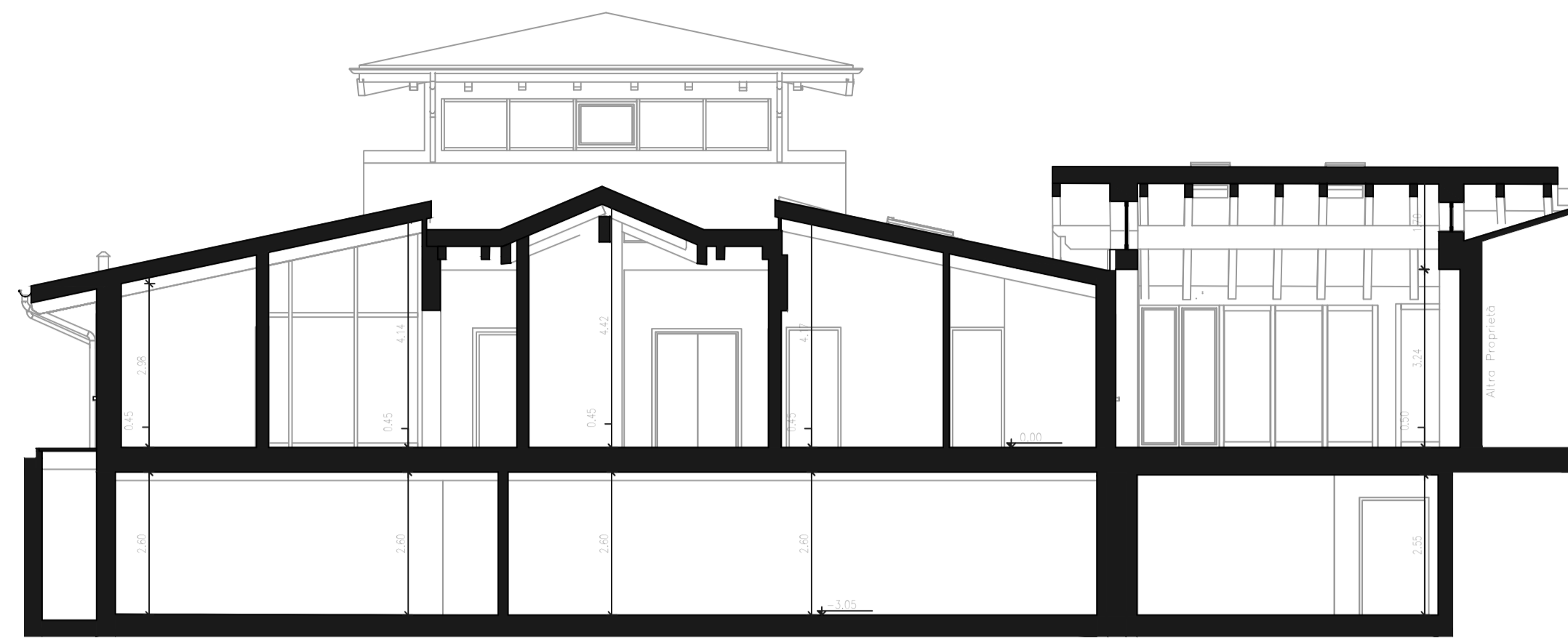
Q.rif. -5.00 SEZIONE S1