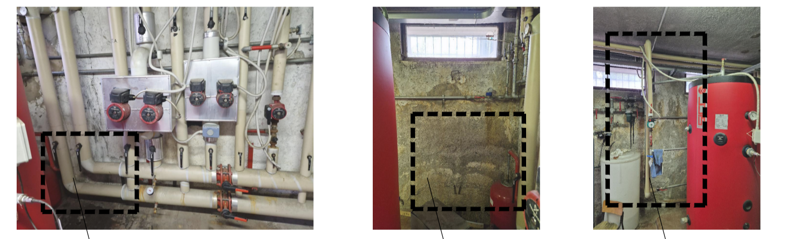
DETTAGLIO MODIFICA IMPIANTI ESISTENTI. Three annotations with arrows pointing to the photos: 1. 'estensione del collettore esistente per derivazione nuovo circuito miscelato di alimentazione impianto radiante nuovo asilo'; 2. 'spostamento valvola di intercettazione linee acqua refrigerata da gruppo frigorifero e nuovo collegamento su fondo collettore'; 3. 'derivazione nuova linea di ricircolo e ACS con miscelatore termostatico per alimentazione nuovo asilo'.