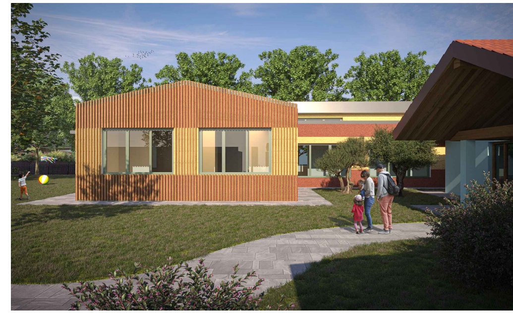
VISTE FOTO INSERIMENTO PROGETTO