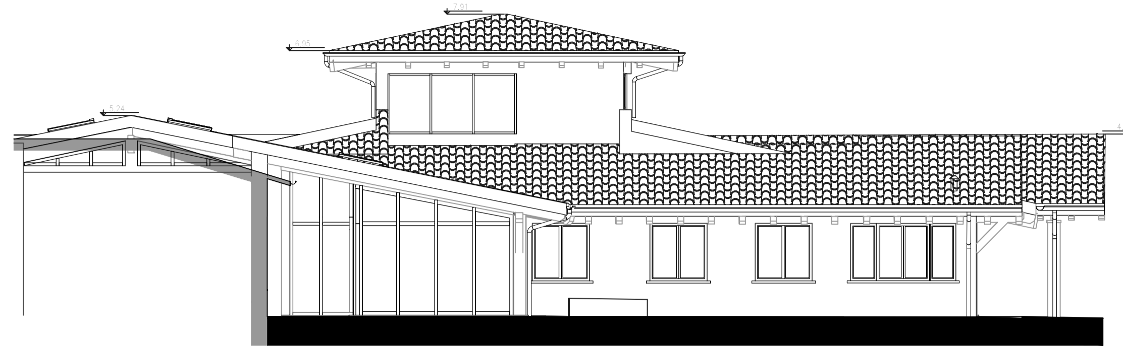
Q.rif. -5.00 PROSPETTO P4