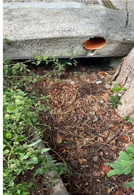
Imbocco tra intubata e cielo aperto