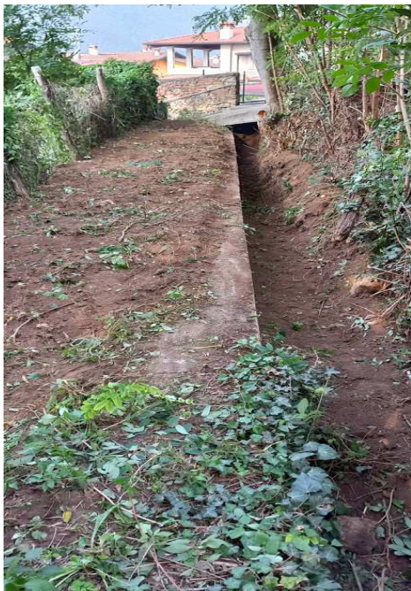
Seriola a cielo aperto pulita