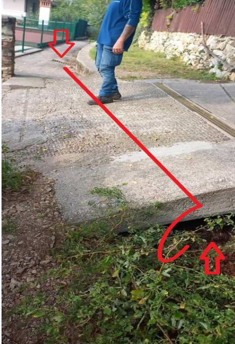
Seriola intubata tappata

SETTORE TECNICO - LAVORI PUBBLICI- MANUTENZIONI E PATRIMONIO