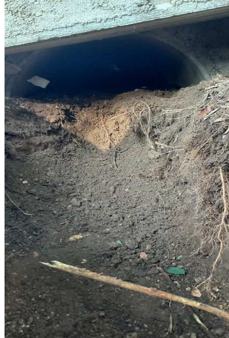
Seriola imbocco a cielo aperto pulita

"Ai sensi del Regolamento Europeo 679/2016 si informa che i dati contenuti nella presente sono trattati con mezzi cartacei e/o informatici e comunicati agli incaricati interni, nonché ad eventuali altri soggetti, la cui facoltà di accesso ai dati è riconosciuta da disposizione di legge. I dati non sono diffusi, se non previsto da normative cogenti applicabili. E' possibile esercitare i diritti previsti dagli articoli dal 15 al 21 del citato Regolamento, rivolgendosi al Titolare del trattamento (Comune di Concesio). Maggiori informazioni sono disponibili consultando le informative sulla privacy dell'ente."