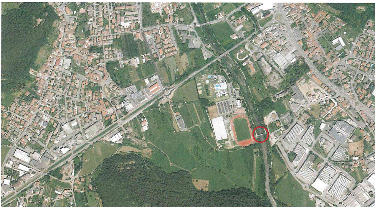
Ortofotografia con indicazione della struttura

La presente relazione riguarda la variante in corso d'opera nell'ambito dell'intervento di manutenzione del ponte ciclopedonale sul Fiume Mella, in località Campagnola nel territorio comunale di Concesio (BS).