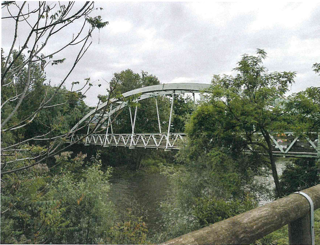
Viste da monte del ponte dalla pista ciclopedonale in lato destro del Fiume Mella