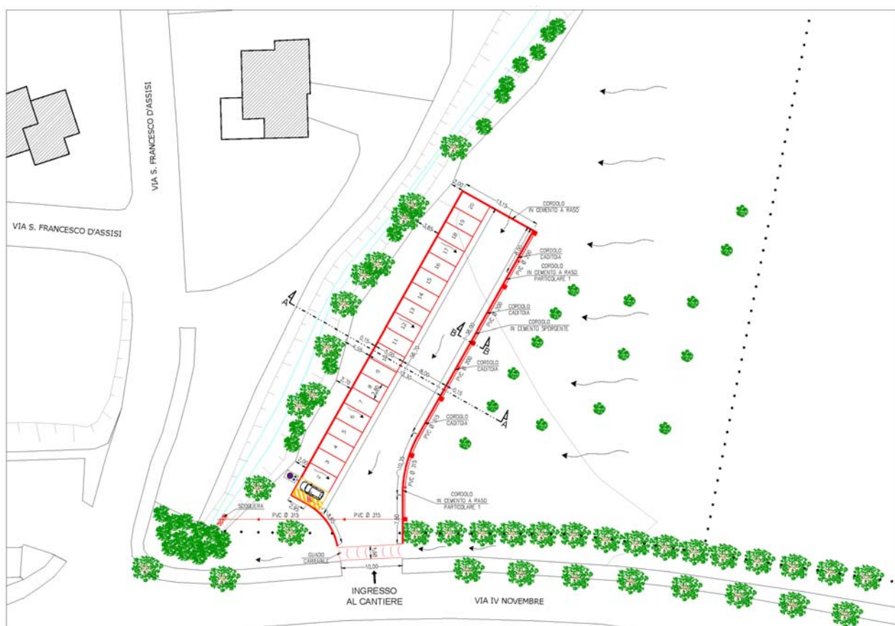
Planimetria con indicazione delle opere di progetto in rosso.

Il cantiere si svilupperà in area verde, all'interno del "Parco delle querce" di via IV novembre, nel quale verrà realizzato un parcheggio per 20 autovetture, con pavimentazione in ghiaia e erba-block.